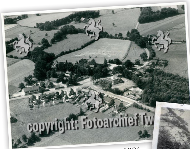
Luchtfoto Beuningen 1981