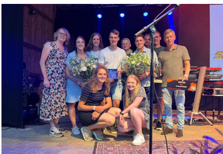
Dames en Heren Team Beuningen Sportploeg 2023 Gemeente Losser

Dames Winnaar KTO Straat cup 4 tegen 4 Dames winnaar Nederlands straat competitie. Dames winnaar veld competitie